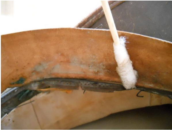
Remoción de microorganismos del reverso de la banda suave