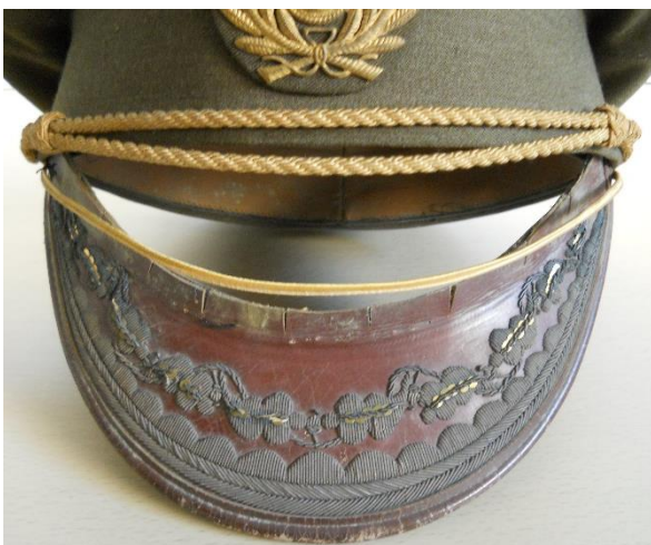
Descosidos (visera descosida en su totalidad)