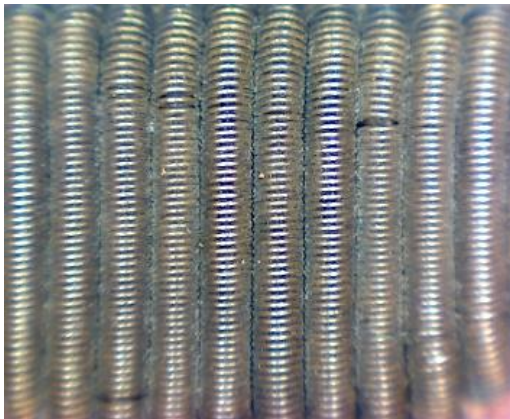
Detalle de suciedad en hilo metálico de la visera