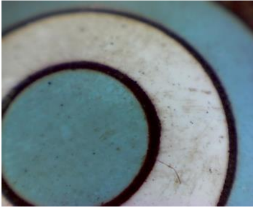
Escarapela metálica. Suciedad superficial