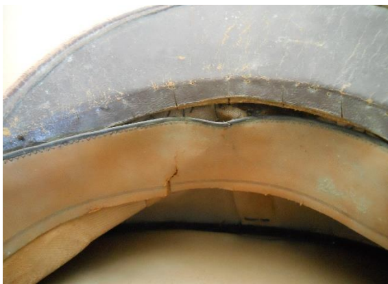
Banda suave: detalle de descosidos, rotura y actividad fúngica.