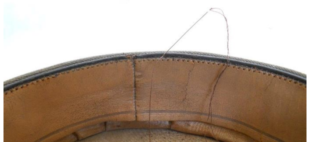
Costura de la banda suave