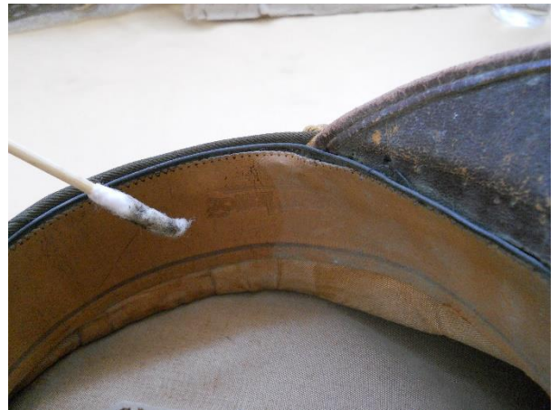
Remoción de microorganismos del anverso de la banda suave