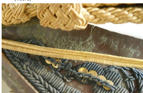
Detalle de biodeterioro por actividad fúngica