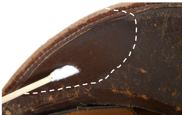
Nutrición del cuero de la visera