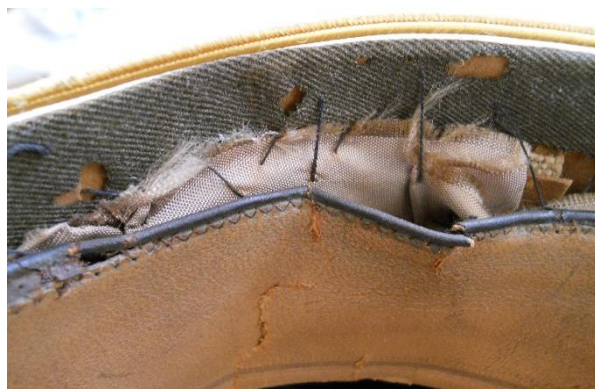
Banda suave: descosidos, roturas y faltantes de soporte textil por deterioro biológico