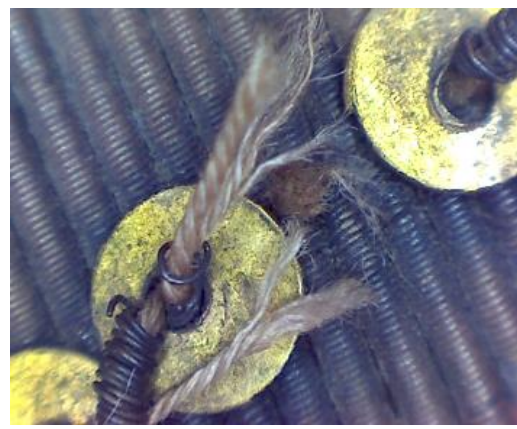
Detalle de rotura del hilo metálico de la visera (ornamentación)