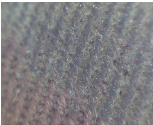
Mancha solida sobre textil externo