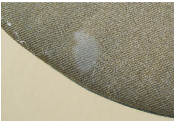
Mancha sólida en textil exterior. Pelusas