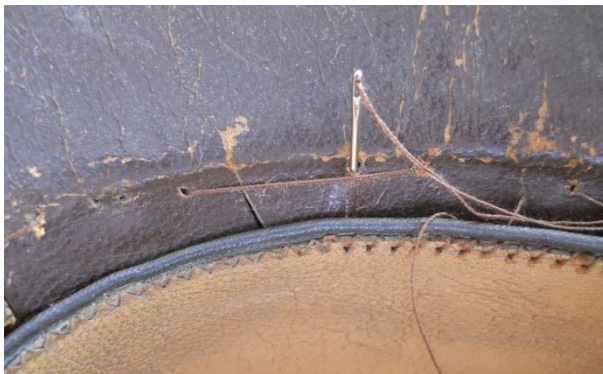
Costura de unión de la visera al cuerpo del gorro