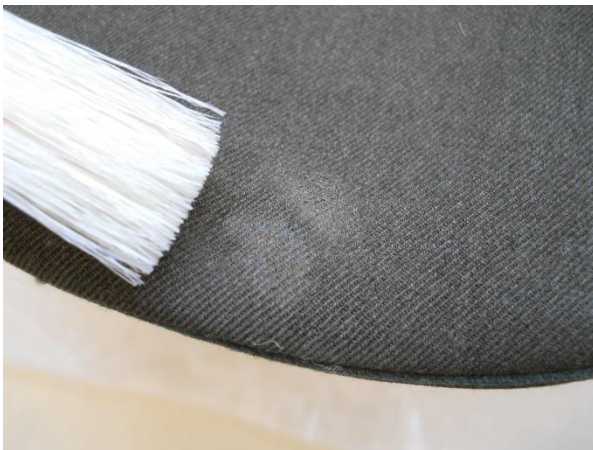
Limpieza mecánica de manchas sólidas