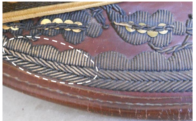
Limpieza del hilo metálico