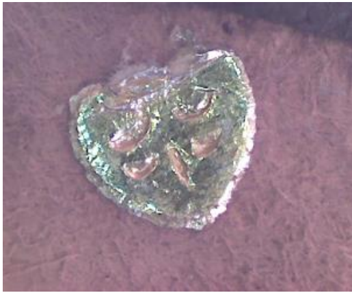
Etiqueta adherida en el reverso de la banda suave