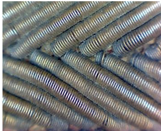
Detalle de suciedad en hilo metálico de la visera