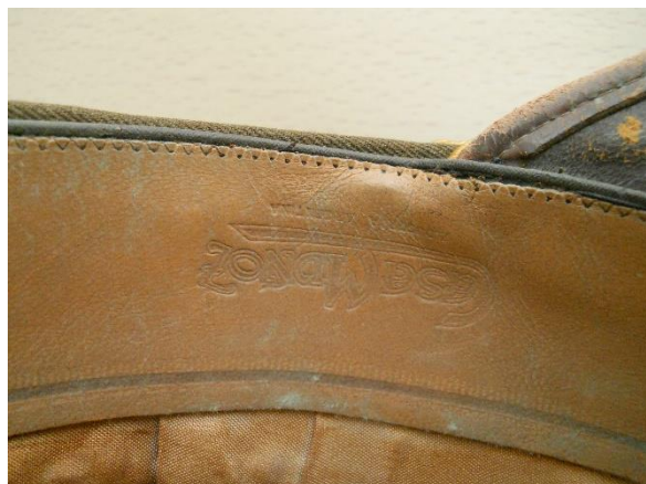
Detalle del fabricante sobre cuero de la banda suave