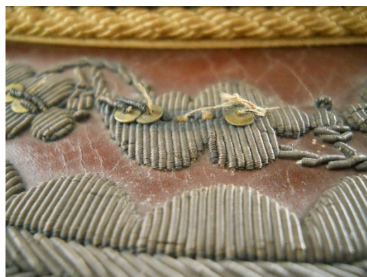
Rotura en ornamento de hilo metálico y mostacillas (visera)