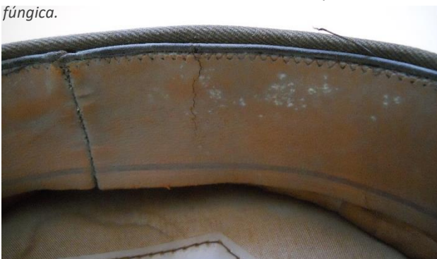
Detalle de roturas, manchas y actividad fúngica