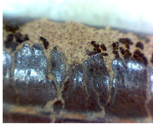
Desgaste del cuero de la visera (borde exterior). Abrasión